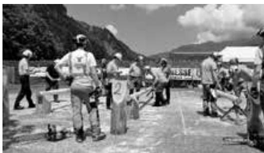
Holzereiwettkampf des Ob- & Nidwaldner Forstpersonalverbandes

Der Juni 2023 war geprägt von grossen Events, die im Sportcamp Melchtal stattgefunden haben. Vom 2. bis 3. Juni 2023 wurde der erste Zentralschweizer Holzereiwettkampf im Sportcamp Melchtal durchgeführt. Er wurde vom Ob- & Nidwaldner Forstpersonalverband organisiert und war ein gelungener Anlass.